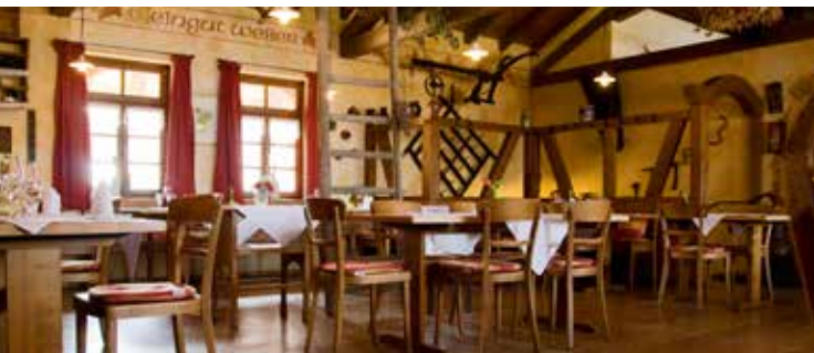
Weinprobe mit anschließendem 3-Gang-Menü

Während der Weinprobe im Weingut lernen Sie Wissenswertes über das Kulturgut Wein im Weingut Weber. Ein Aperitif und 3 Weine warten auf Sie. Anschließend genießen Sie ein kulinarisches 3-Gang-Menü. Visite guidée de la cave à vin, découverte des méthodes modernes de vinification, suivies d'une dégustation.