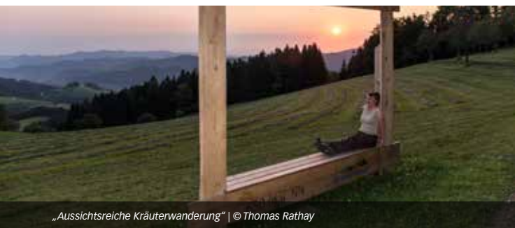
„Aussichtsreiche Kräuterwanderung“

Kommen Sie mit uns auf eine lehrreiche Kräuterwanderung und genießen Sie bei einem guten Tropfen die Aussicht vom Vogesenblick auf Oberharmersbach. Stärken können Sie sich am anschließenden Lagerfeuer mit Suppe und Stockbrot! Randonnée à Oberharmersbach à la découverte des herbes, suivie d'un léger repas autour d'un feu de camp.