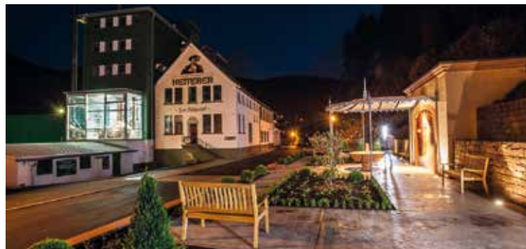
Brauereibesichtigung Ketterer GmbH

Betriebsbesichtigung mit Verkostung. Visite guidée de la brasserie et dégustation.