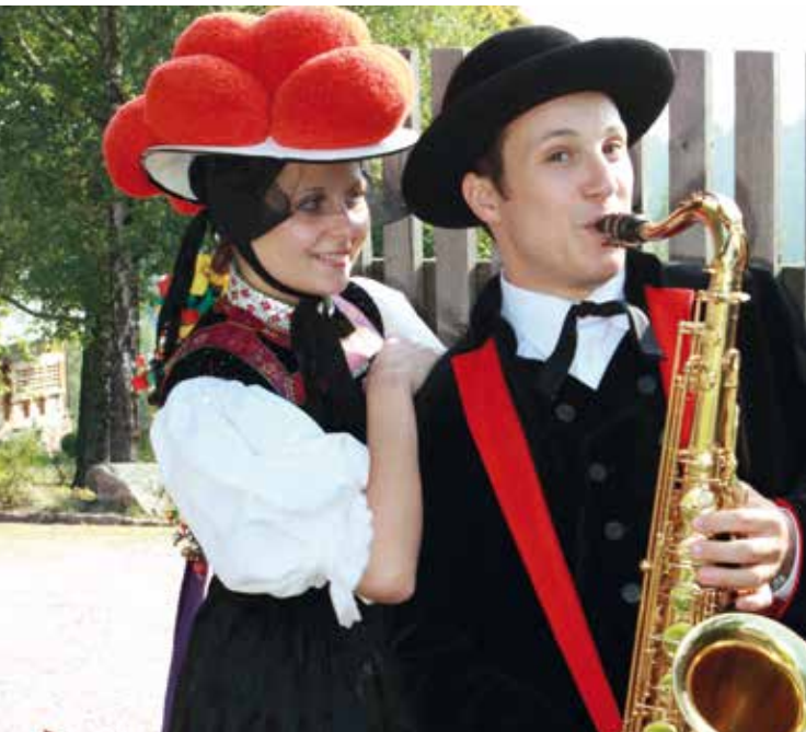
Brauchtsaband Husmattehook

Bei Maler Martin in Wolfach-Kirnbach, Talstr. 23 | Frei | Tourist-Info Wolfach Brauchtsaband der Kirnbacher Kurrende in der weltbekanntesten Bollenhuttracht. Mit traditioneller Musik, Tanz, Gesang und kleiner Bewirtung (Bei schlechtem Wetter entfällt die Veranstaltung). Soirée festive en costumes traditionnels. Annulation en cas de pluie.