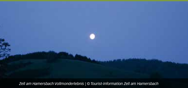
Zell am Harmersbach Vollmonderlebnis