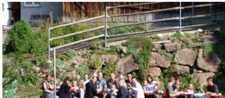
Kleine Wanderung mit Schwarzwaldforelle und Besuch in der Hofbrennerei

Geführter Stadtrundgang mit Einführung in die Geschichte Haslachs und deren Nachtwächter. Genießen Sie zum Ende im Traditionsgasthaus Storchen „Flammenkuchen-satt“! Visite guidée de la ville, suivie d'une dégustation de tartes flambées.