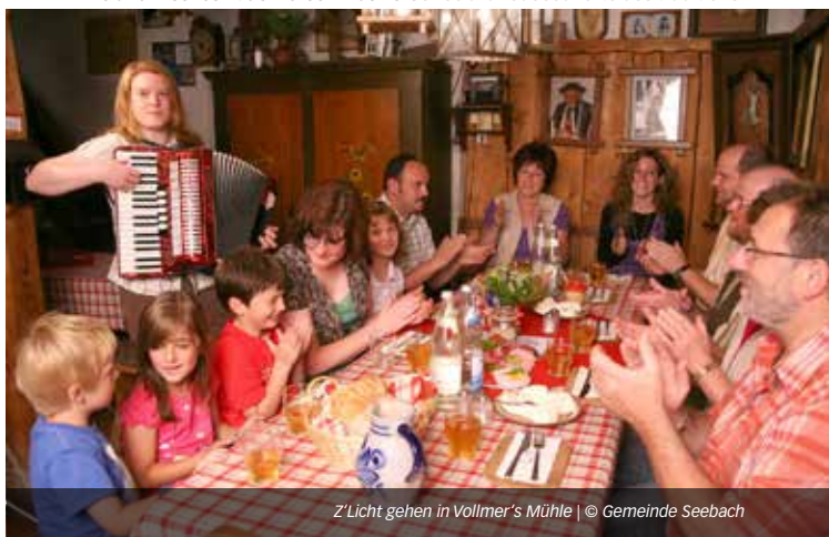
Z' Licht gehen in Vollmer's Mühle

Gemütlicher Brauchtumsabend mit Buttern, Kienspanschniden, Spinnen und Ziehharmonikamusik mit anschließendem Vesper und Laternengang. Getränke und frisches Bauernbrot inklusive. Soirée à la redécouverte des traditions.