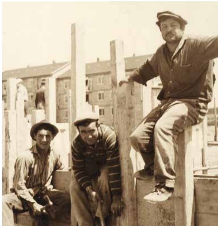
Gastarbeiter in Offenburg

Kommen Sie mit auf eine spannende Führung zum Thema Gastarbeiter und genießen Sie zur Begrüßung ein Glas badischen Wein! Die Sonderausstellung besteht aus einem lokalgeschichtlichen Teil und der Wanderausstellung des SWR International. Visite guidée et exposition sur le thème des travailleurs immigrés.