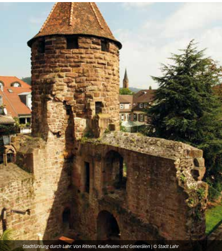
Stadtführung durch Lahr: Von Rittern, Kaufleuten und Generälen

Besucher erleben 600 Jahre Stadtgeschichte. Als Wegzehrung gibt es eine traditionelle Lahrer Murre aus der Genussmanufaktur Burger. Vivez 600 ans d'histoire tout en dégustant nos pâtisseries traditionnelles