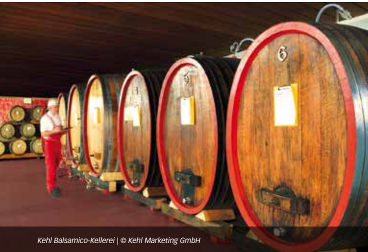
Kehl Balsamico-Kellerei

Ob weiß, rosé oder rot genießen Sie die Vielfalt der Burgundertraube bei einem entspannten Abend in gemütlicher Atmosphäre. Soirée de dégustation de vin blanc, rosé ou rouge de Bourgogne.