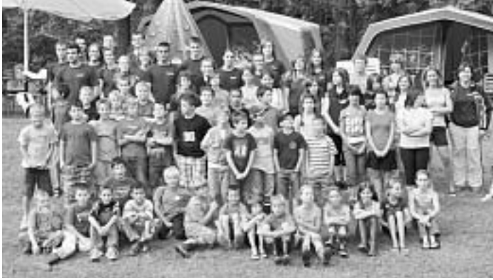
Die Kinder wollten nicht das die Woche zu Ende geht!