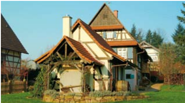
Ortenberger Bauernhaus mit Back- und Brennhäuschen