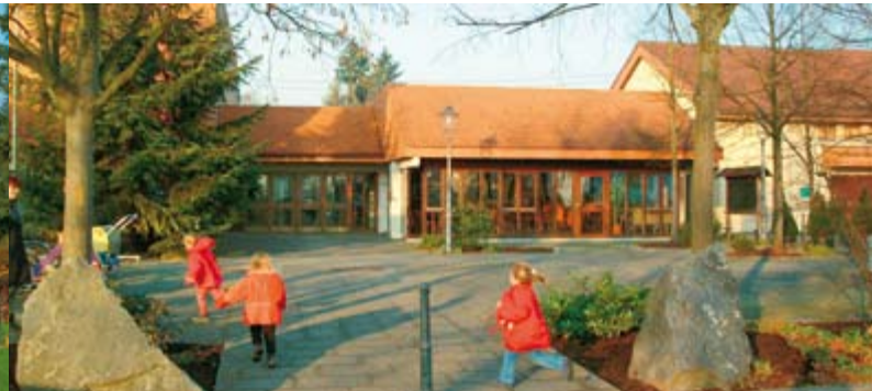
Die Schlossberghalle als lebendige Dorfmitte