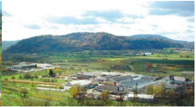
Angesiedelte Unternehmen mit Reserveflächen