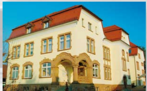
Eine Schule wie aus dem Bilderbuch