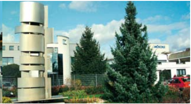
Moderne Wasserkulptur im Dorf der Brunnen