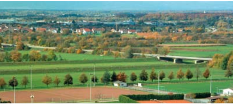
Anbindung an die B33 ohne Ortsdurchfahrt