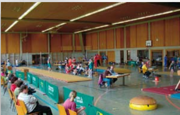
Turnveranstaltung in der Mehrzweckhalle

Klinikum Offenburg, St. Josefs Krankenhaus (4 km)